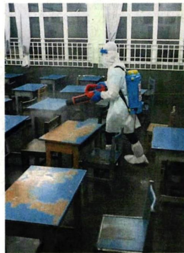
■ 循民小學傳出確診，消毒隊第一時間前往消毒，包括課室。

巧就接到消息有位下午班的学生确诊。”他说，这位学生由于他的家人感染，而受到交叉感染，校方也呼吁所有家长们要留意所有