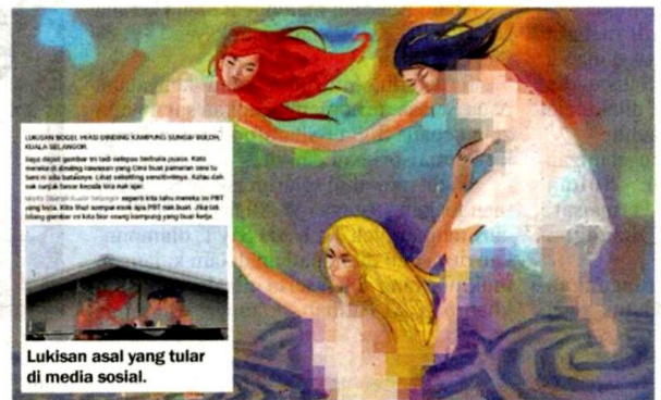
MDKS memandang serius dakwaan pelayar media sosial mengenai gambar lukisan mencolok mata di Sungai Buloh Jeram yang tular di media sosial.

“Mana-mana penggiat seni perlu sentiasa berhati-hati dan menjaga sensitiviti budaya tempatan dalam penghasilan karya seni selain merujuk kepada MDKS terlebih dahulu,” katanya.