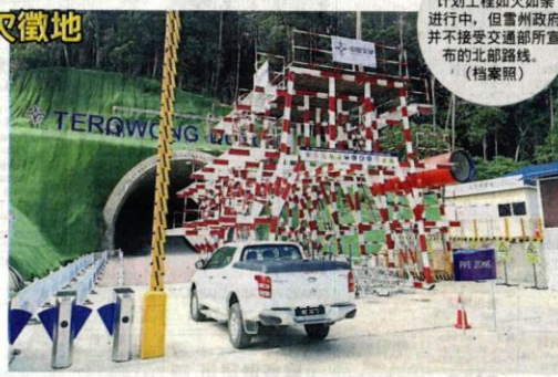
■東海岸鐵路計劃工程如火如荼進行中，但雪州政府并不接受交通部所宣布的北部路線。(檔案照)

通部和中央政府決定更改路線，放棄南部路線改用北部路線，才會造成有關計劃出現延誤。 他說，馬來西亞接公司主席丹斯里莫哈末祖基菲里和魏家祥所說的，因此雪州政府不同意北部路線，令中央政府每日蒙受125萬令吉的說法是不正確，而且也是相當不負責任。 “今日交通部把2.0路線換去3.0路線，由南部路線換去北部路線，因此如果有延誤的話，也是因為更換路線造成，不是雪州政府造成，不應該要由雪州政府承擔相關責任。”