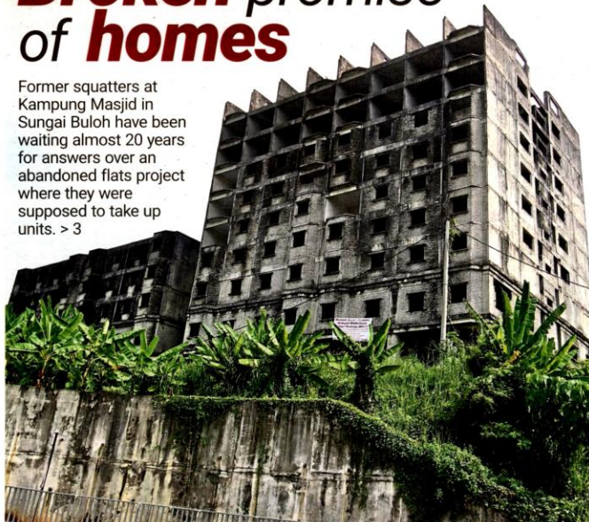
Dilapidated: The uncompleted flats in Kampung Masjid, Sungai Buloh, which villagers say is sometimes used to shoot horror films these days.

Former squatters at Kampung Masjid in Sungai Buloh have been waiting almost 20 years for answers over an abandoned flats project where they were supposed to take up units. > 3