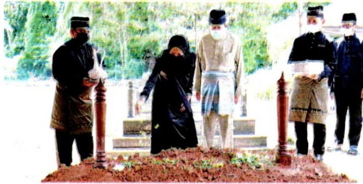
TENGGU PERMAISURI NORASHIKIN menabur bunga rampai di pusara ayahandanya sambil diperhatikan Sultan Sharafuddin (belakang) di Makam Diraja Shah Alam, Seksyen 5 di Shah Alam semalam.

"Patik mewakili seluruh lapisan pentadbiran kerajaan negeri dan rakyat Selangor merafak sembah takziah kepada Sultan Sharafuddin Idris Shah dan