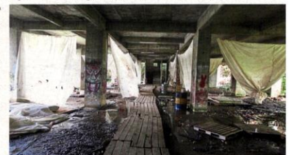
The uncompleted flats in a sorry state at Kampung Masjid, Sungai Buloh.

More than 70 squatter families relocated 19 years ago in exchange for flat units that never came