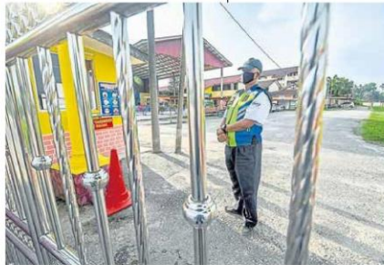
■ 吉隆丹州校园爆发疫情，4月3至16日期间共有464名学生和教职员确诊；州内落实行管令的7个县属学校，全部从4月18日起关闭2周。

他昨晚出席鹅麦县开斋活动后说，雪州国家安全理事会在周日（18日）的会议上，由州政府向教育部建议关闭八打灵县的学校。阿米鲁丁说，州政府仔细研究后，发现这19所学校确实有必要停课，并向教育部提出这项建议。八打灵县卫生局昨日发通告说，八打灵柏兰岭县和八打灵乌达玛县的19间学校即日起关闭，其中育才华小是唯一一停课的华小。（TSI）